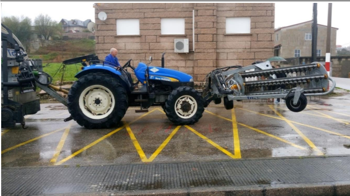
Vetikate ja adru kogumise tehnika.