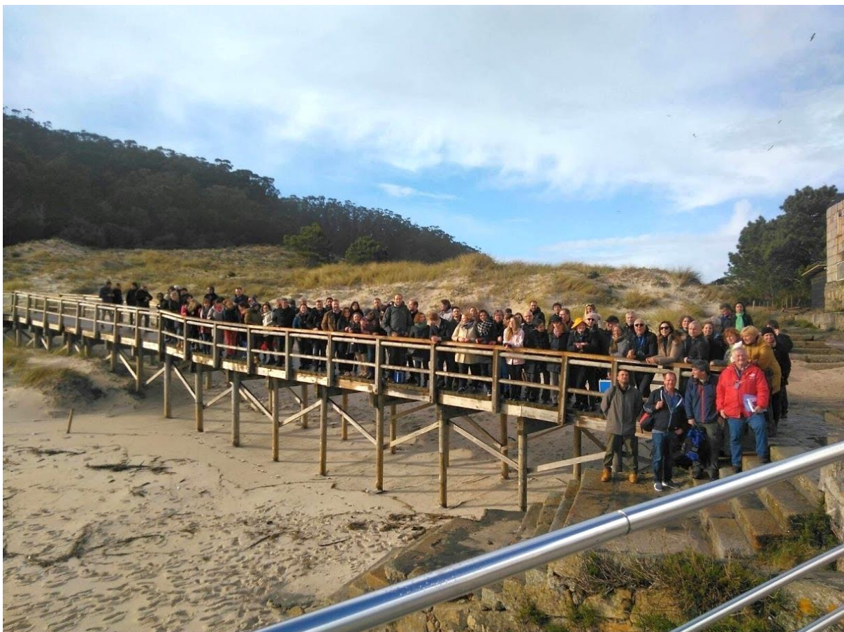
Cies Islands saarte looduspargi külastus. Saartel ei ole ühtegi prügikasti, oma prügi tuleb külastajail saarelt lahkudes kaasa võtta.