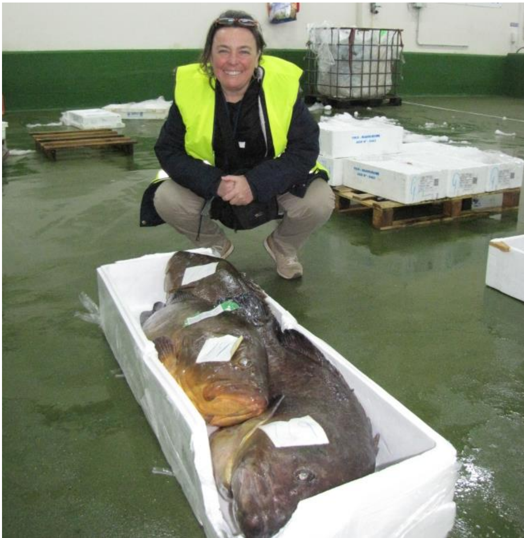
Kalaoksjon Vigos hommikul kl 04.00