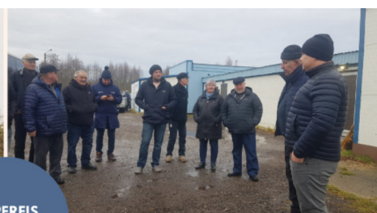
ÕPPEREIS SAAREMAALE 9.-10. NOV