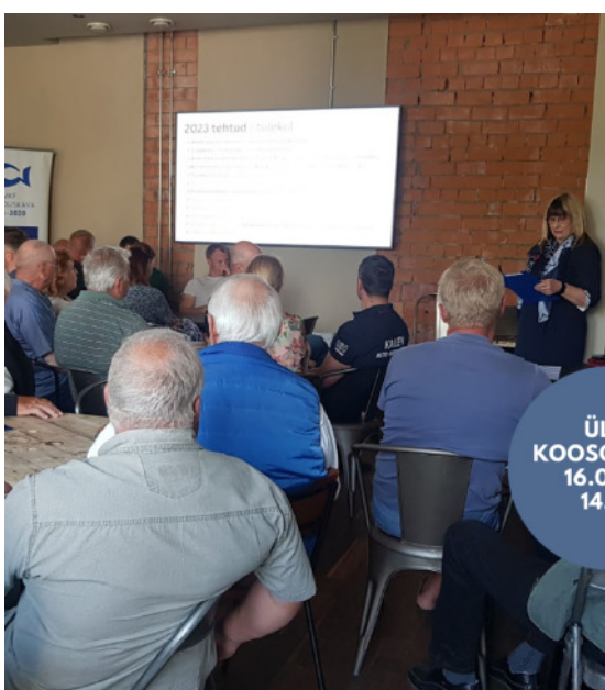
ÜLD- KOOSOLEKUD 16.06 JA 14.09