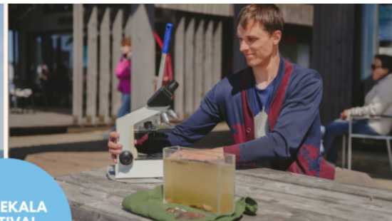
TUULEKALA FESTIVAL 27.05