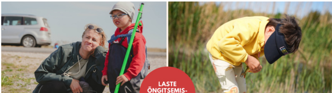
LASTE ÕNGITSEMIS- VÕISTLUS 27.05